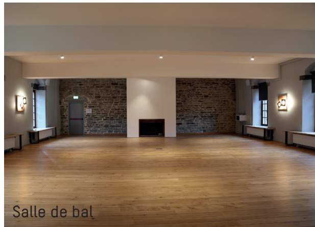
Salle de bal