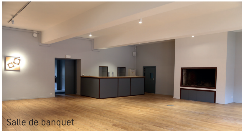
Salle de banquet